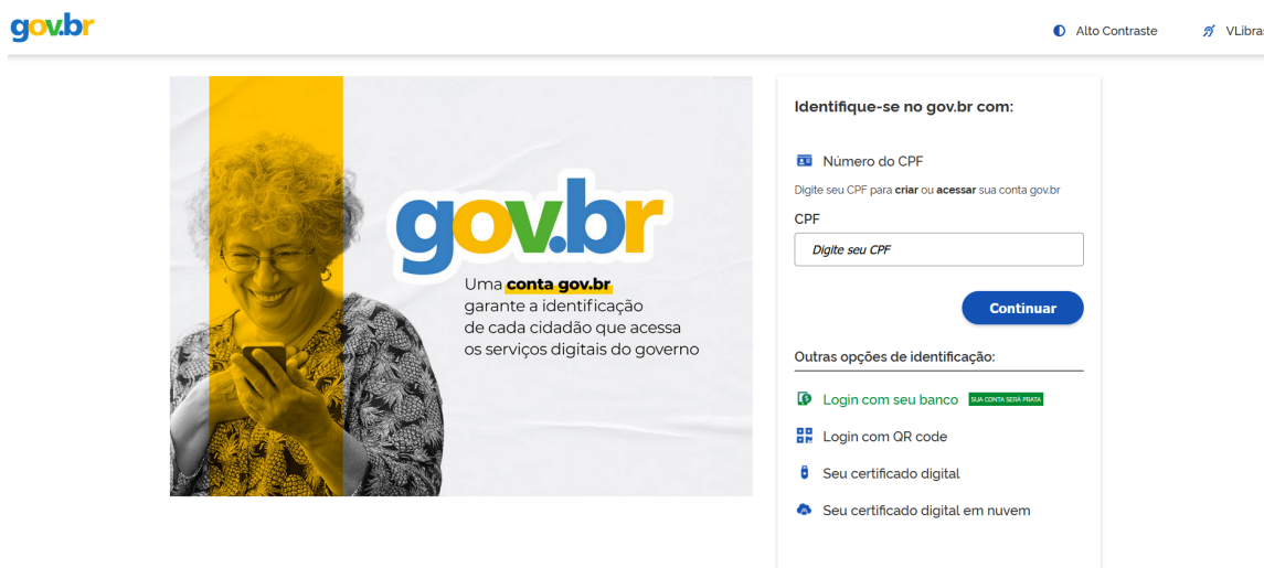
Figura 1. Tela de login Assinador ITI.